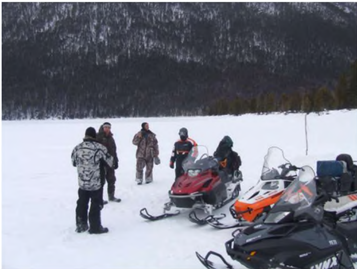
Фото 3. Зимнее путешествие по Байкалу.

Следовательно, рассматривая вопрос об экологическом туризме, в частности на Байкале, необходимо учитывать многогранность проблем, подчас специфических для нашего региона, не говоря уж о менталитете местных жителей и туристов.