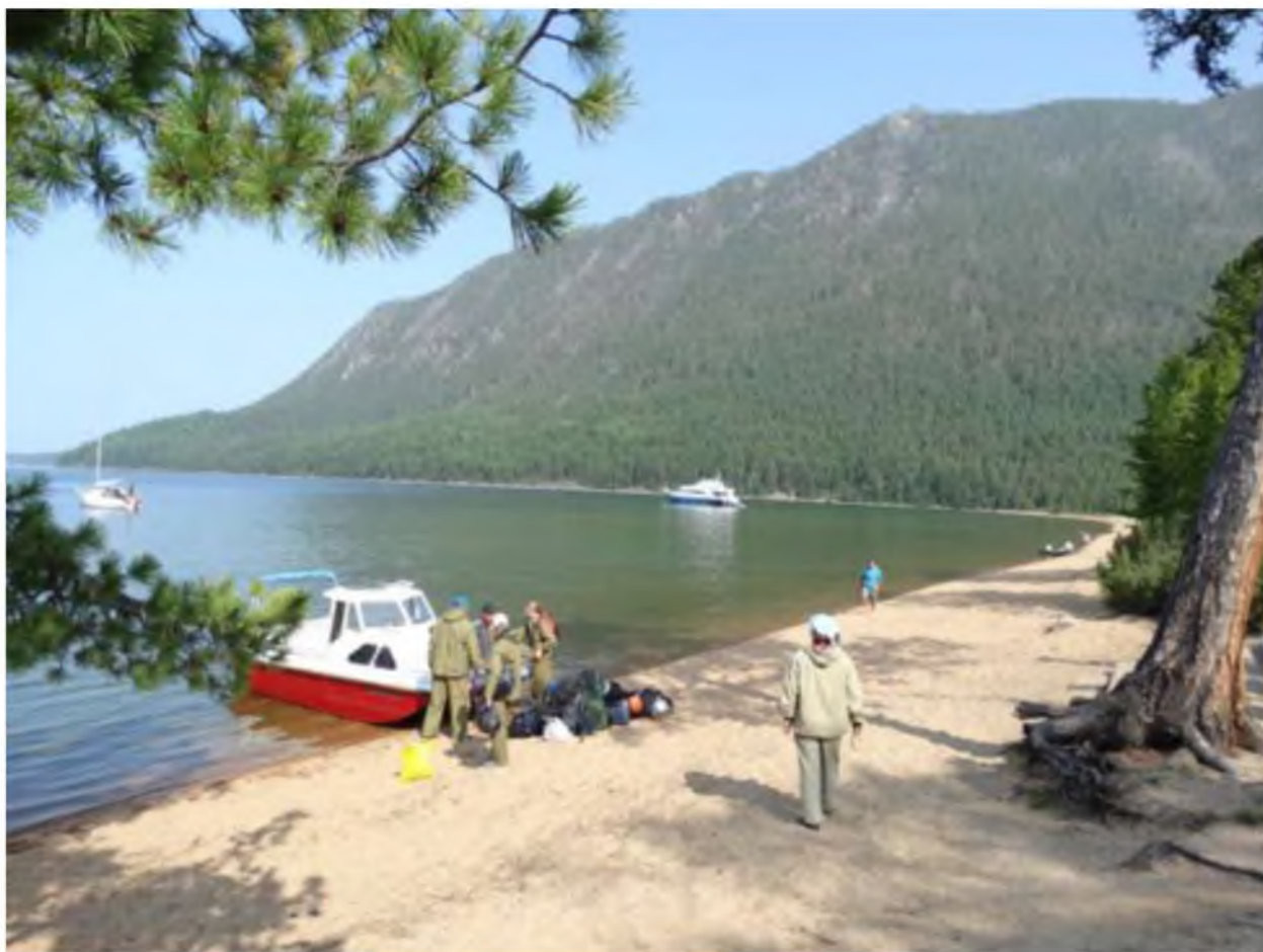
Фото 4. Заказник «Фролихинский». Губа Аяя. Прибывшие на катерах и лодках туристы отсюда начинают свой поход к озеру Фролиха.

Более того, в России немало заповедников, где традиционно развивался туризм до их организации – «Столбы», «Тебердинский», «Кавказский» и т. д. В таких заповедниках уже сложились экосистемы с присутствием человека. Остаётся только научно определить допустимый уровень воздействия человека на среду его присутствием.