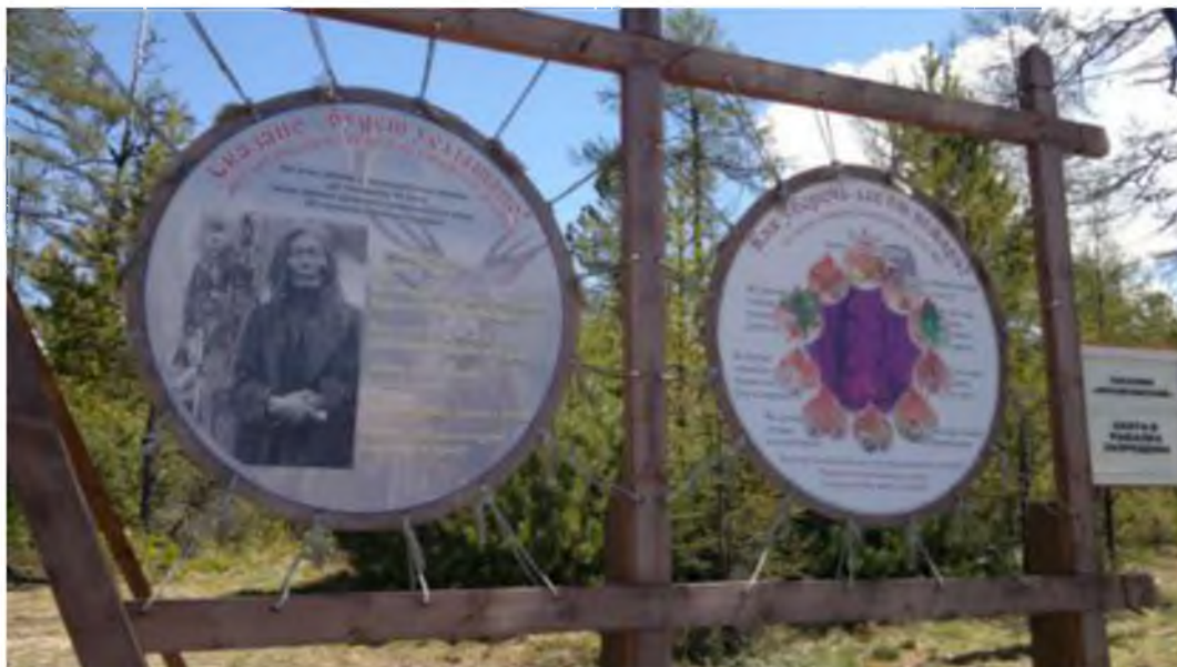
Фото 1. Наставления туристам.

Ситуация не простая. Однозначного решения быть не может. Метод тотальных запретов не реализует ожидаемое.