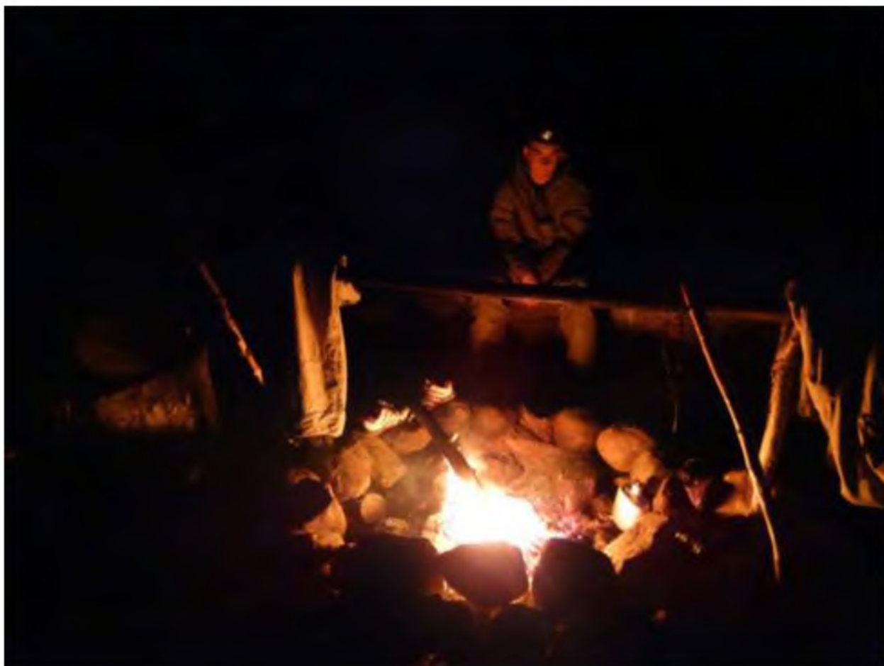
Фото 2. Мечта туриста свершилась. Ночь у костра ...

Практика показала, что аншлаги типа «Береги лес от пожара!» нужны только для отчетов. Трата денег бесполезная. Результативнее будет на эти деньги в местах отдыха обустраивать места для кострищ. Достаточно очистить от дёрна площадку 3 х3 м, забить колышки для тагана и положить бревно - беседку.