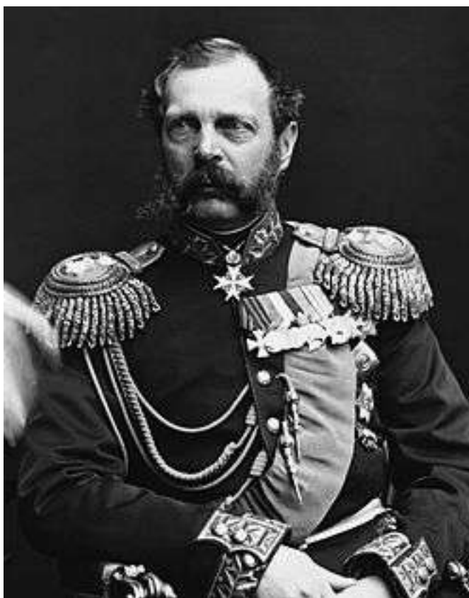
Рисунок 1. Александр II Николаевич Романов

В 1837 году Александр решил лучше узнать свою страну и отправился на семь месяцев в путешествие по России, причем не только по Европейской части, но и в район Урала и Сибири.