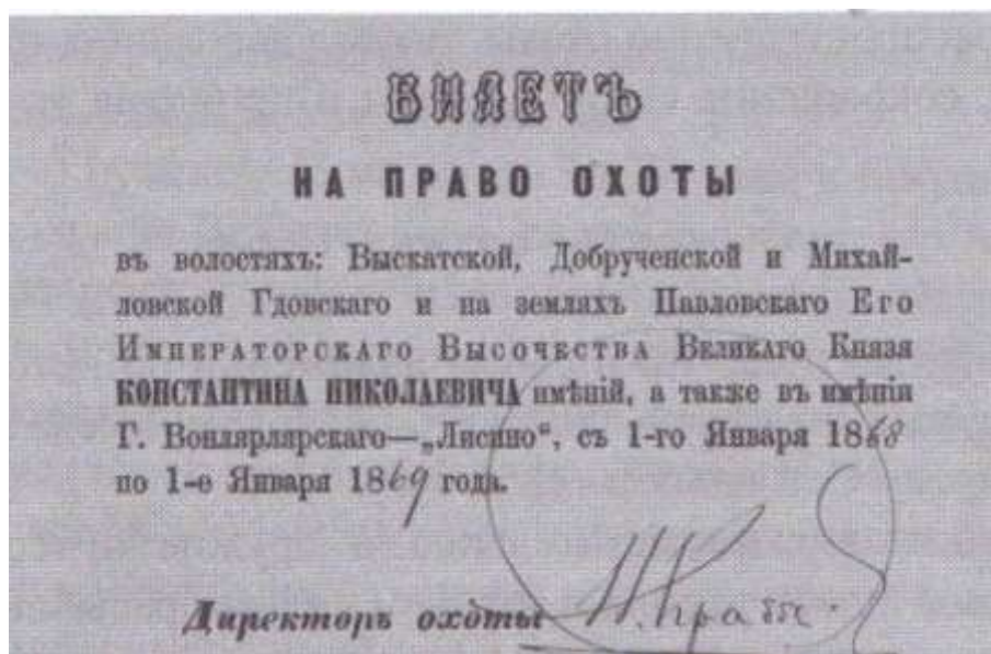
Рисунок 2. Охотничий билет Великого князя Владимира Александровича, действителен с 1 января 1868 по 1 января 1869 года. [2]