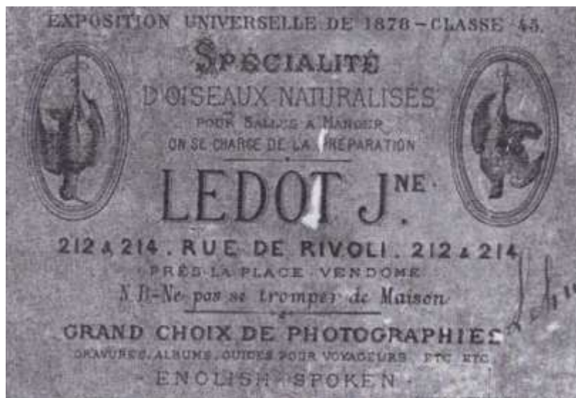
Рисунок 5. Медаль, на оборотной стороне указана торговая марка [5]

отечественных мастеров таксидермистов, приглашали специалистов из Франции. На 45-й Всемирной выставке в Париже в 1878 году были представлены трофеи императорской охоты, они были отмечены медалями.