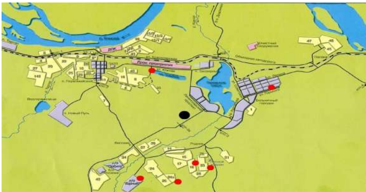
Рис. 2. Места отстрела медведей в городской черте г. Железногорска (красные точки); гибели женщины (чёрная точка)

После известной в июле 2009 г. трагедии, когда рано утром во время спортивной пробежки по лесному массиву на окраине города медведь напал на женщину и убил её. После этого случая при администрации г. Железногорска была организована специальная группа быстрого реагирования по профилактике хищничества и вынужденному отстрелу бурого медведя. За три летних сезона (2011-2013 гг) по сообщениям от граждан было зарегистрировано 72 случая проникновения медведей в городскую зону, в критических ситуациях было отстреляно 6 медведей.